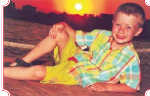
«Я под солнышком лежу». Автор Клара Ибрагимова, управление.