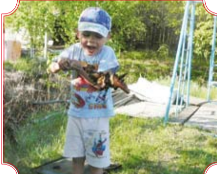
«Ай, горячо!» Автор Мария Леонова, управление.