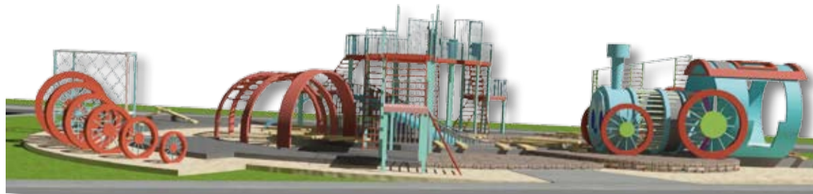
«Голубой вагон» – один из конкурсных проектов.