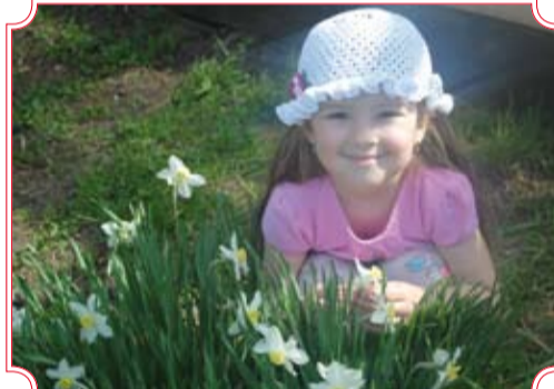
«Дверь в лето». Автор Екатерина Суглоба, УПР.