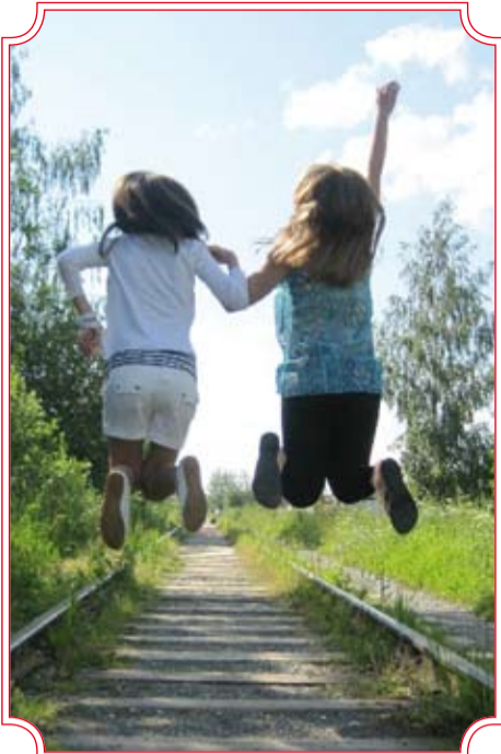
«Нам не нужен паровоз, мы летать умеем». Автор Елена Абрамова. 1 место.

Л ЕТНЕЕ солнышко и впрямь пронизывает все снимки, которые прислали нам читатели на конкурс, посвящённый Дню защиты детей. Участников как всегда было много, и отбирали мы только лучшее.