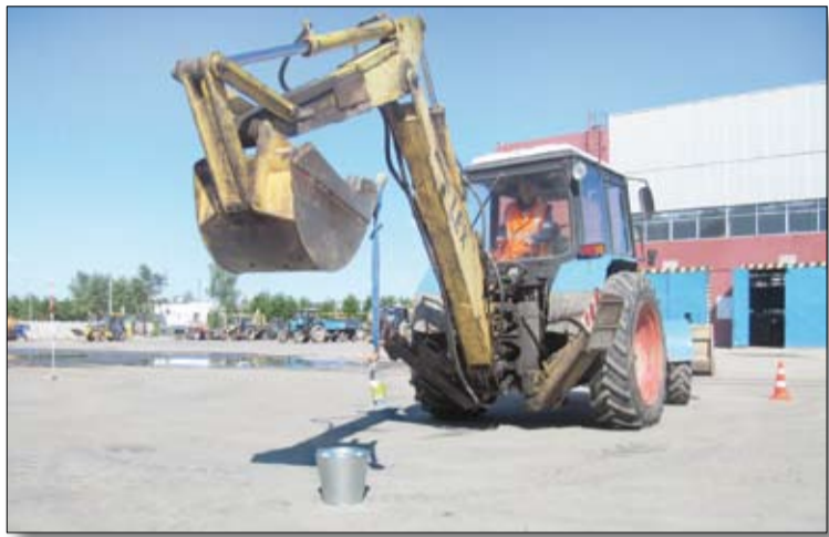
Справиться с заданием экскаваторщикам помогают природное чутьё и опыт.

Цветы на клумбах летом, вычищенные от снега тротуарные дорожки зимой, центральная часть города, равно как и вся территория Уралэлектромеди, всегда безупречно прибранная уси-