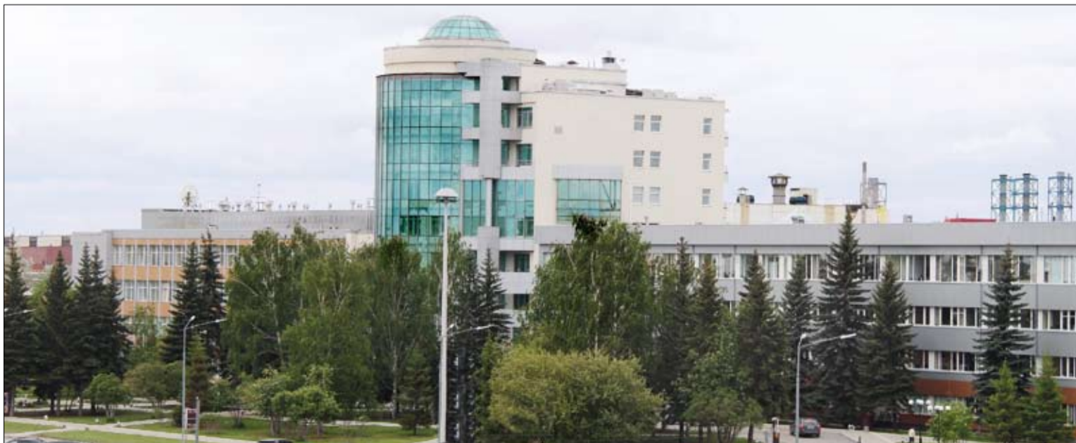
В том, что и на территории предприятия, и за её пределами всегда чисто и красиво есть и заслуга экологов.

Синоптики обещают на праздники хорошую погоду, так что три выходных подряд можно использовать и для работы в садах, и для отдыха на природе!