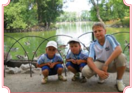
«Трое из ларца». Автор Анна Глаздинова.