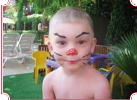
«Мимикрия». Автор Ольга Коржева, УГМК-Телеком.