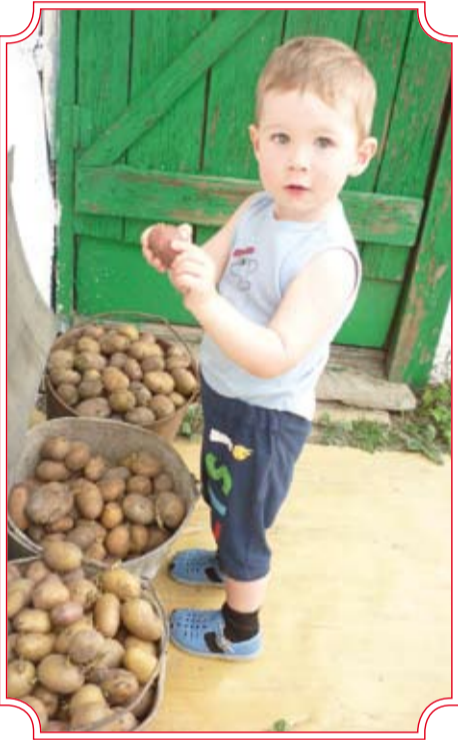
«Тот не знает наслажденья, кто картошки не сажал!» Автор Екатерина Николаева. II место.