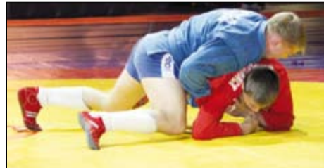
Бои были жаркими.